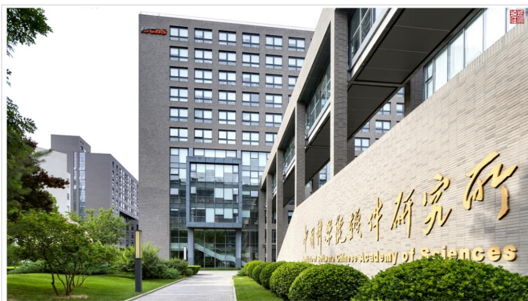
中国科学院 软件研究所 五号科研楼

Canon EOS 5D Mark III F4.0 1/333 ISO100 2018/06/08