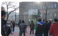
积极健身 喜迎龙年