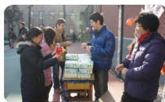
参加活动的职工和研究生领取奖品