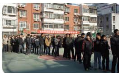
篮球场上热闹非凡