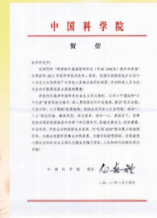
白春礼院长发来贺信