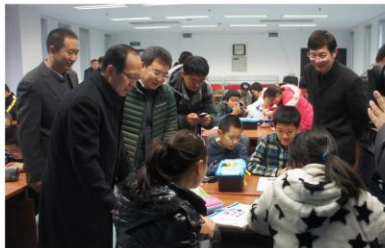
苟仲文(左二)一行考察活动主题课

初中开放性科学实践活动是充分利用社会资源, 并且面向北京市初一、初二年级全体学生, 主要采用“主题课”形式实施, 利用寒暑假、节