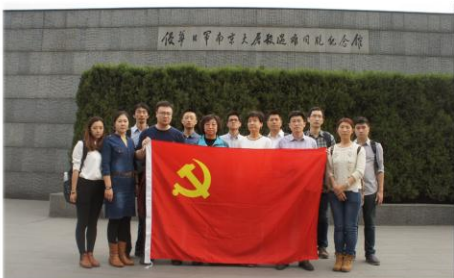
参观侵华日军南京大屠杀纪念馆

为进一步加强党员干部爱国主义教育和党性锻炼，培育践行社会主义核心价值观，纪念世界反法西斯战争暨中国人民抗日战争胜利70周年，11月6日至7日，软件所组织2015年优秀共产党员、党务工作者等共14人赴中山陵、侵华日军南京大屠杀遇难同胞纪念馆开展爱国主义教育活动。