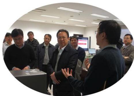
谭铁牛副院长一行听取重大任务进展情况汇报

中科院科技促进发展局局长严庆及前沿科学与教育局、重大科技任务局、条件保障与财务局等部门的有关负责同志陪同调研。