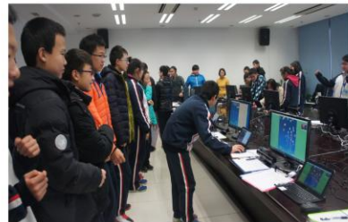
学习体验创新人机交互技术

假日及工作日进行动手实践。软件所“初中开放性科学实践活动”围绕创新人机交互技术, 共开设了17门课程。从11月到2016年1月底学期结束, 全北京市初中生共有1.8万人次报名参加软件所的课程, 学习和体验创新人机交互技术, 并从中培养创新意识和实践能力。